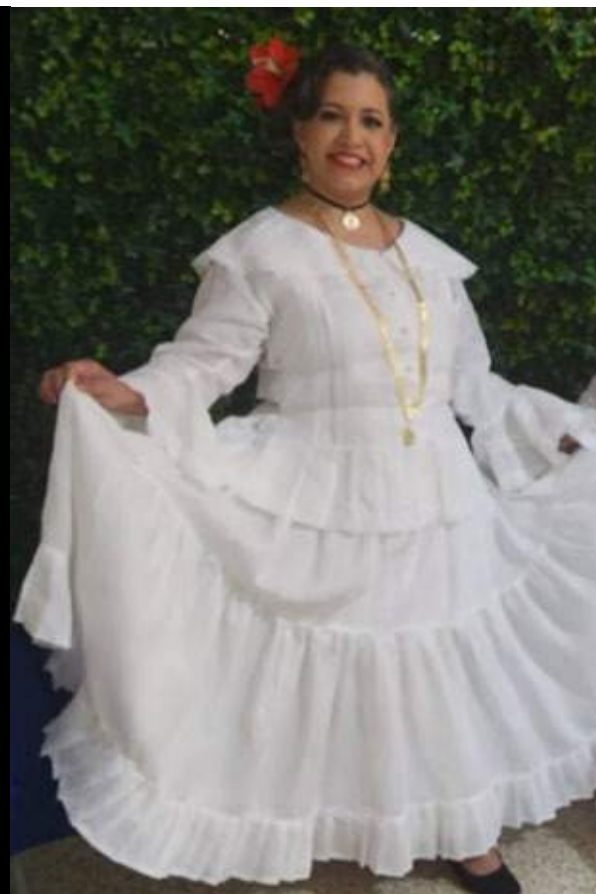
Diversos arreglos de chambras y basquiñas al final basquiña chepana.