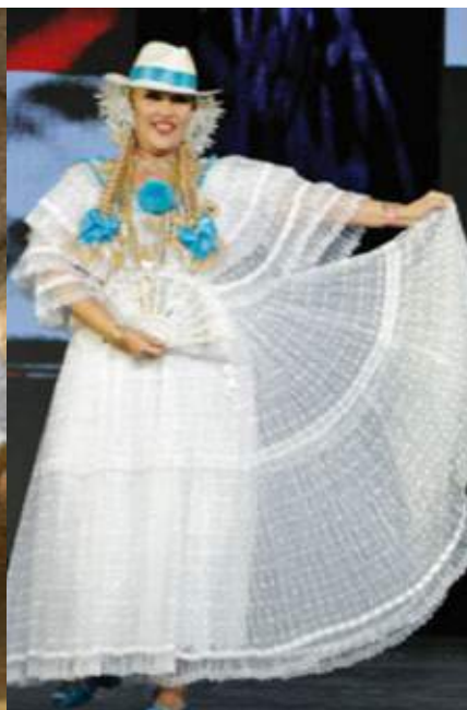
Con sombrero Panamá trenzas y tembleques.