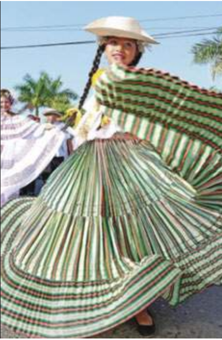
Pollera Tumba hombre - reclamada como la pollera de La Villa de Los Santos.