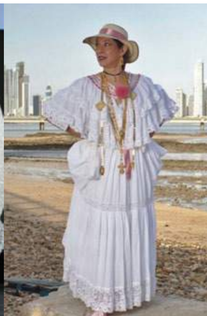
Estilo ocueño con pimpollos, veragüense en color pastel y pollera blanca con sombrero pinta'o.