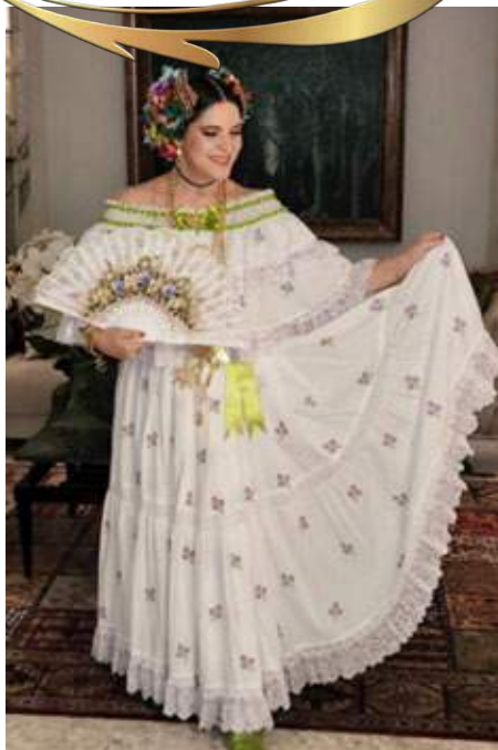
Pollera de coquito penonomeña, lazo en vez de mota con 2 broches, adelante y atrás, no lleva peinetón, gallardete torcido y tembleques de colores.