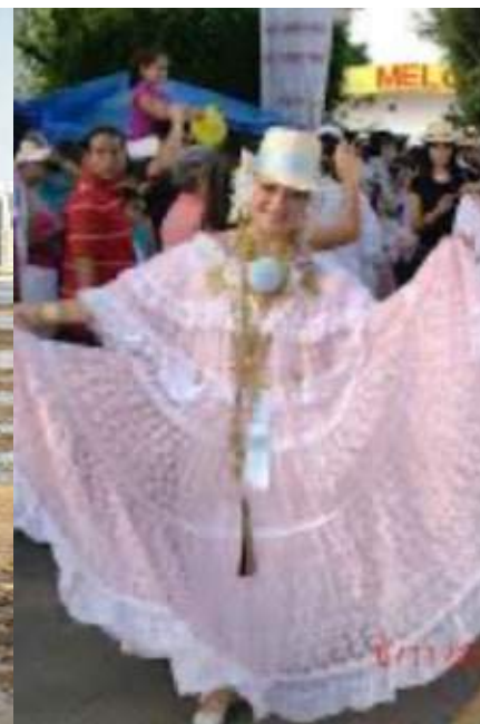
Pollera en color pastel con sombrero. Arreglo libre.