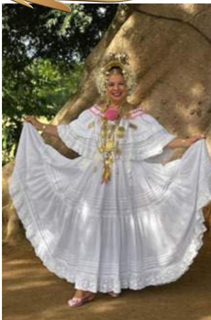
Estilo santeño con tembleques.