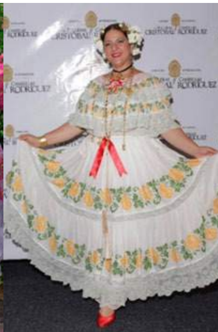
Pollera ancestral deben arreglarse con accesorios de acuerdo a la época y arreglada con flores naturales.