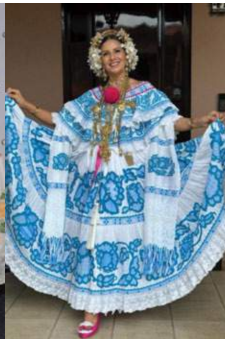
Polleras de gala con labor corrida.