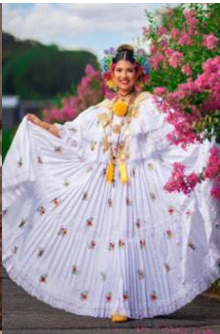
Pollera de coquito siguiendo estilo santeño.