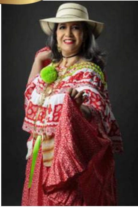
Montuna Santeña o Festival.